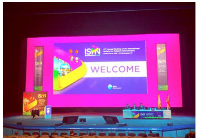
写真4 発表の会場となった The ICC Birmingham Hall A