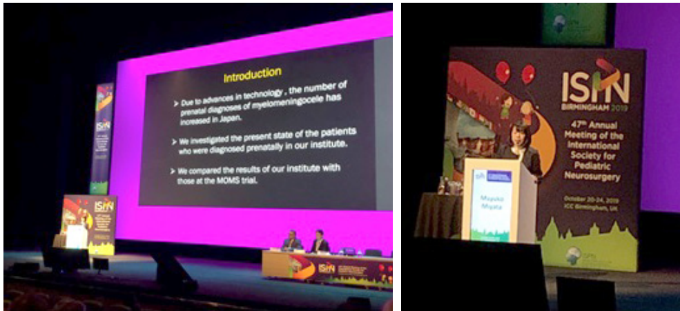
写真 5, 6 myelomeningocele の当施設での現状について発表させて頂きました

に思います。夜は普段お話しする機会がないような、日本を代表する小児脳神経外科の先生方とお食事をご一緒することができ、いろいろなお話を聞かせて頂き、このような経験も国際学会の醍醐味であるように思いました。3日目のセッションは昼過ぎまでで、そこからは学術的なプログラムはなく、学会のオフィシャルツアーなどの観光プログラムが組まれており私もロンドンまで足を伸ばしました。