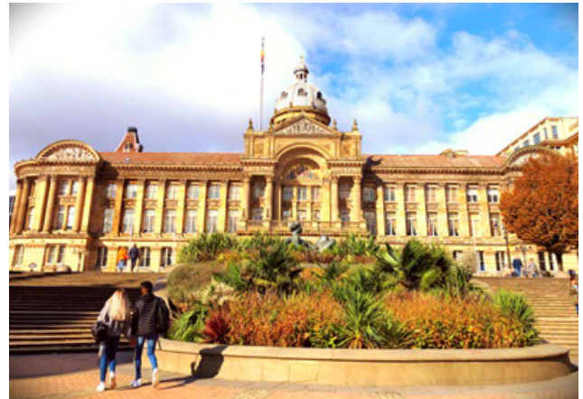
写真2 バーミンガム・ヴィクトリア スクエア