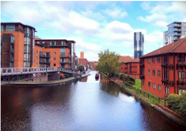
写真1 会場周辺の運河

2日目の10月21日からはいよいよプログラムが始まりました。Craniofacial sessionから始まり、夜まで数多くのセッションに参加しました。Keynote Lectureの後に各施設からの発表が続き、各疾患への理解が深まったとともに、日本とは少し異なる興味深い治療法などがあり、セッションを聞いている時間はあっという間だったよう